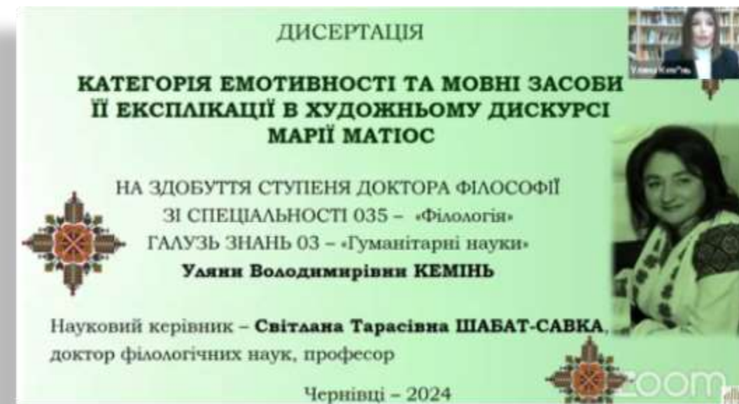
Захист PhD дисертації аспірантки кафедри